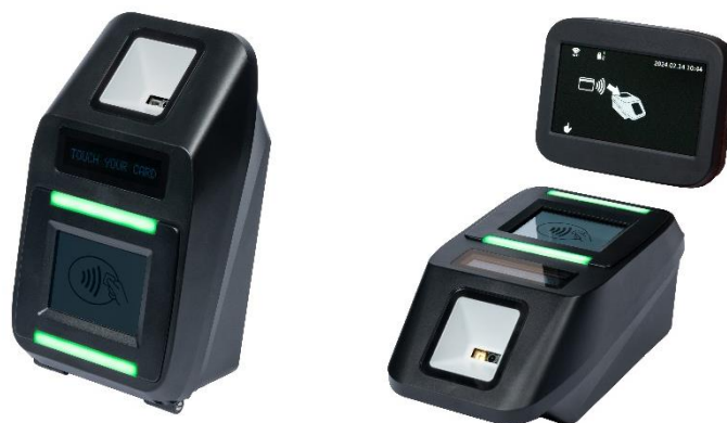
<専用リーダ(イメージ)>

お手持ちのタッチ決済対応のカード（クレジット・デビット・プリペイド）や、カードが設定されたスマートフォン等を、専用リーダにタッチすることで、そのまま乗車（降車）いただけます。