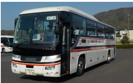
【松江一畑交通が運行する空港連絡バス】