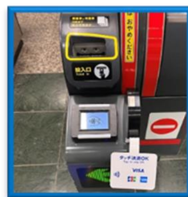
(出場時に専用端末にかざす)