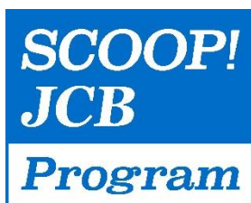
<SCOOP! JCB Program ロゴ>

ブランドキャンペーンとは、JCB ブランドのカード(JCB のロゴがついている、カード番号が 35 から始まるカード)をお持ちのすべての会員様を対象としたおトクなキャンペーンです。このような活動を通し、お客様に選ばれるカードブランドをめざしてまいります。