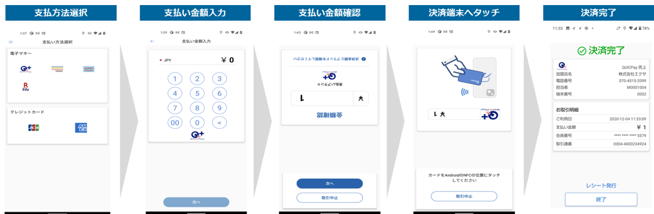
（加盟店様での Tap On Mobile 決済、決済端末画面遷移イメージ）