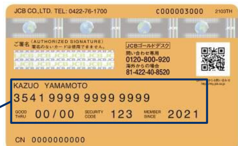
ゴールド(新デザイン/裏面)